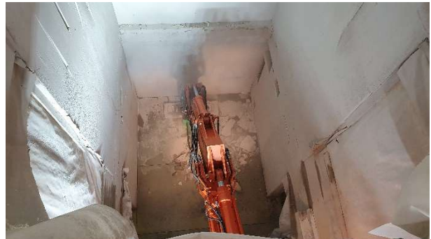
Continuazioni lavori decantazione finale e biologia