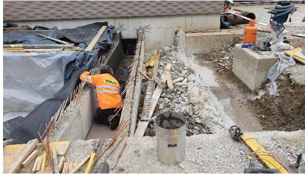
Continuazione demolizioni per vano montacarichi